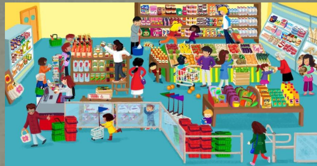
Ребенок в магазине