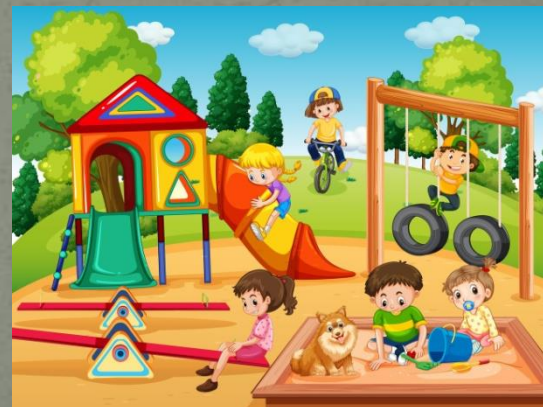
Ребенок на детской площадке